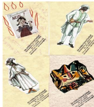
Corsi e Laboratori