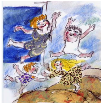
Creatività - musica